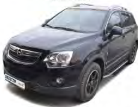
Рис.4 Вид автомобиля с порогом