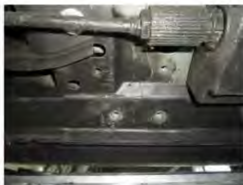
Рис.3 Место установки заднего кронштейна