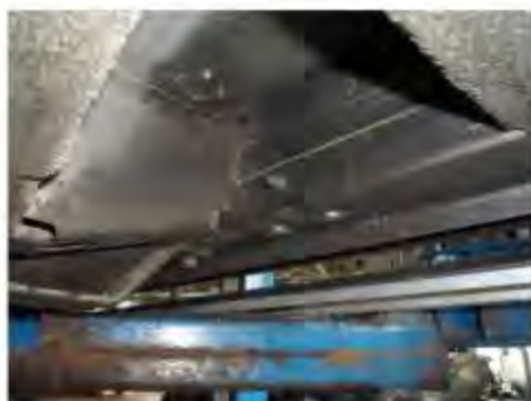
Рис.2 Место установки переднего кронштейна