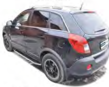
Рис.5 Вид автомобиля с порогом