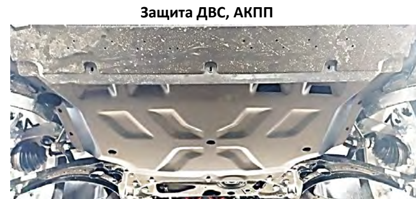
Защита ДВС, АКПП